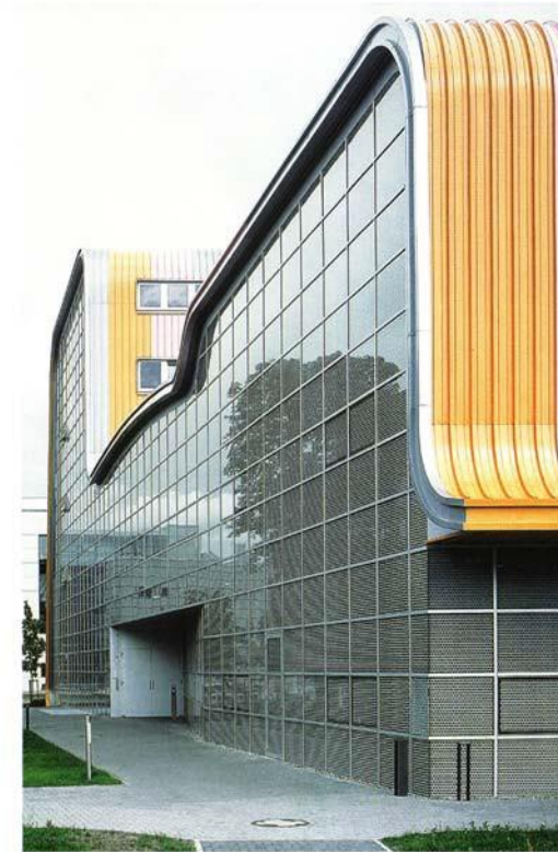
ZPVP Zentrum für Produkt-, Verfahrens- und Prozeßinnovation GmbH Experimentelle Fabrik Magdeburg Sandtorstr. 23, 39106 Magdeburg